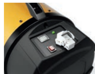
DISPLAY AND SOCKET FOR REMOTE THERMOSTAT