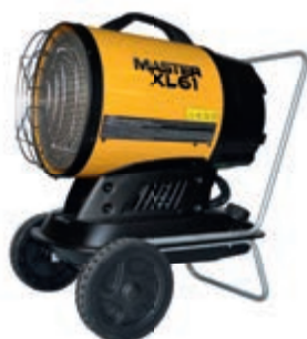
XL 61 CON CARRELLO